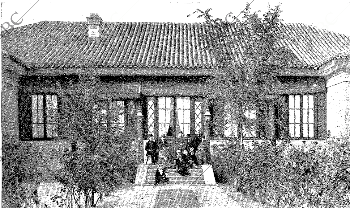
FACHADA DE LA LEGACIÓN ESPAÑOLA EN PEKÍN