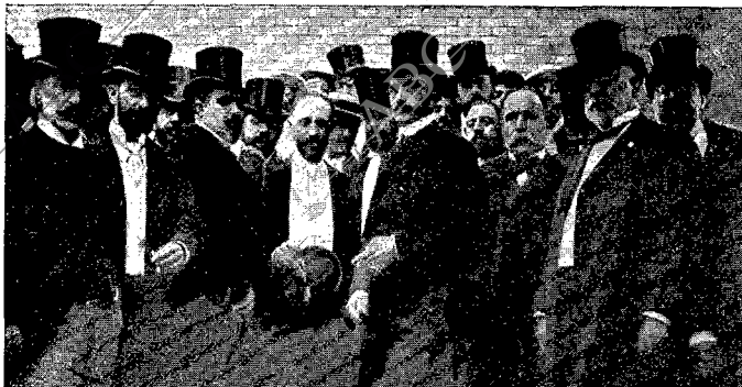
LEGADO BACQUÉ, EL MINISTRO DE LA GOBERNACIÓN Y VARIOS INVITADOS DIRIGIÉNDOSE A VISITAR LAS NUEVAS INSTALACIONES

votos todos los españoles, y muy especialmente los que han tenido ocasión de apreciar las relevantes dotes de inteligencia y caballerosidad que adornan al distinguido diplomático.