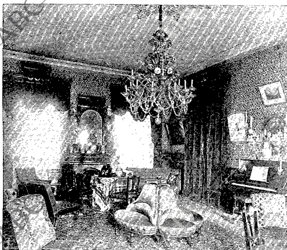
SALÓN DE RECEPCIONES

enfrente de la de Alemania, todas ellas edificadas en la calle de Las Legaciones, llamada por los chinos Tung-Sung-Mi-Siang. El Sr. Rodríguez procuró amueblarle con la mayor riqueza, por tratarse de la casa de nuestra nación y para sostener con ello dignamente el nombre de España en la capital del Celeste Imperio.