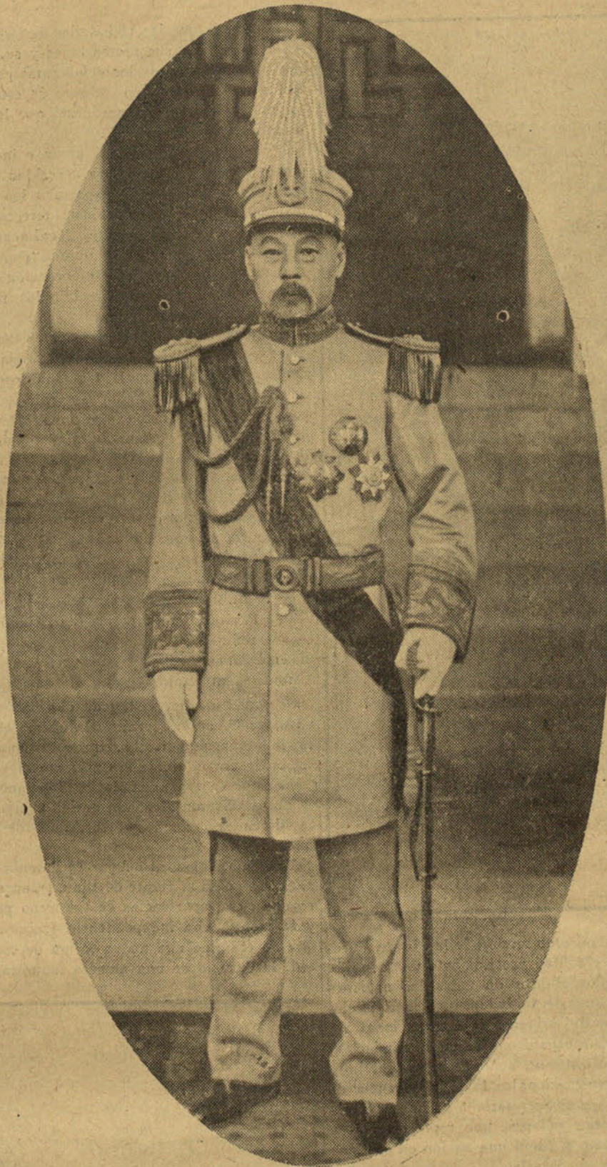
FENG KUO-CHANG Presidente de la República de China.

El Pacífico, desde los primeros meses de la guerra, en el año 1914, había sido limpiado de los buques de guerra alemanes, de los que fué más nombrado el «Emdem», de estación en Kiao-Tcheou;