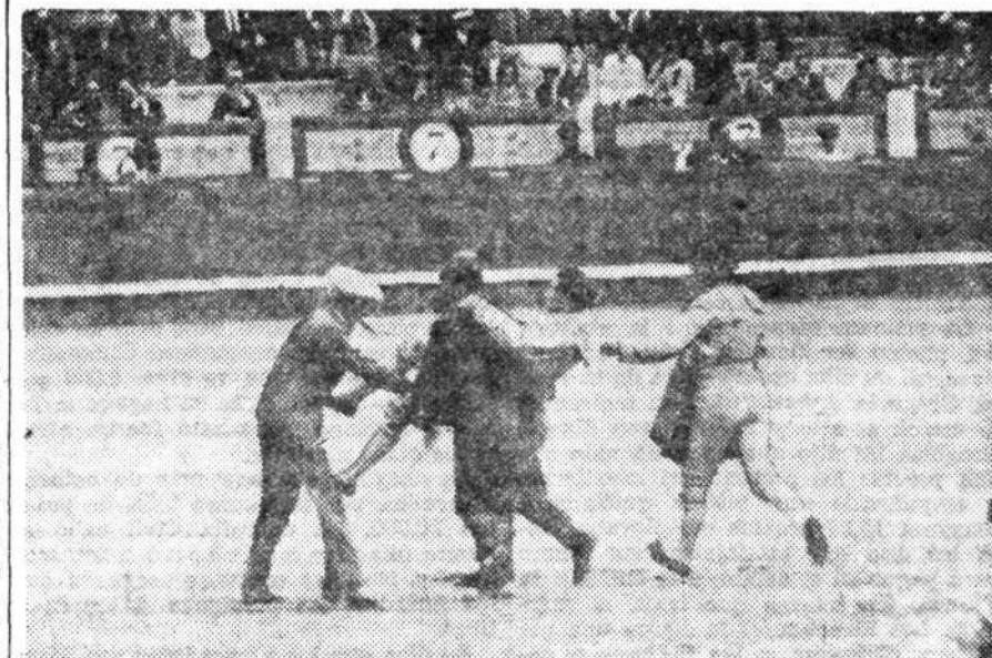
DE LA CORRIDA DE AYER EN MADRID.—PALOMINO ES CONDUcido A LA ENFERMERIA. ANTE LA HEMORRAGIA, EL MOZO DE ESPADAS LE APLICA EL TUBO DE GOMA COMPRESOR