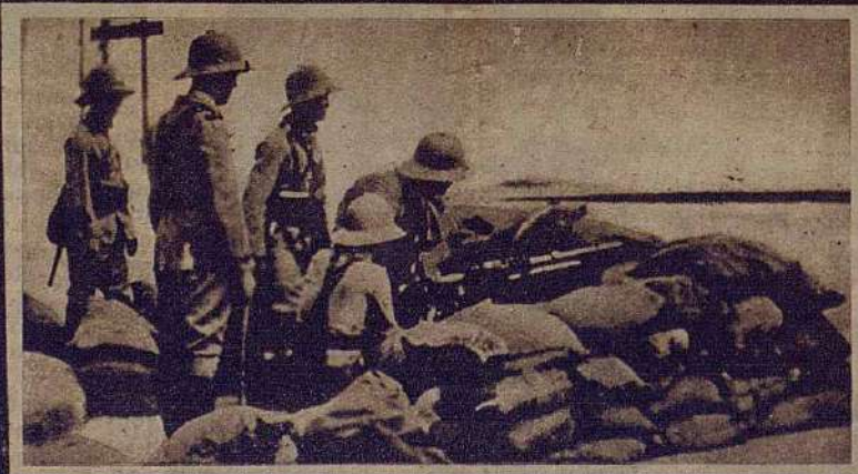
Xang-Hai és també plaça forta d'Anglaterra i França. L'atac del Japó es dirigeix no solament contra Xina; anhela les posicions angleses i franceses. Les guarnicions xineses que sostenen aquestes potències estrangeres no podran resistir l'empenya japonesa per si soles...

Els exèrcits xinesos disposen de tanes, d'armes auto-àtiques, d'artilleria moderna i, sobretot, d'una aviació potent i audaç. A primers de juliol les forces aèries de Xina comptaven amb vuit-cents cinquanta avions de combat, ultra nombrosos avions de bombardeig i de caça, i llurs corresponents equips, de les gestes dels quals ens informen els diaris. Aquesta aviació supera en valor i capacitat de lluita la de les tropes invasores.