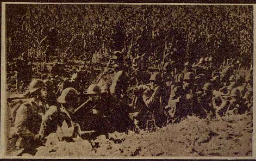
Tropes japoneses als voltants de Xang-Hai.