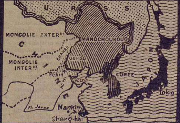
1905: Corea. — 1931: Manxukuo. — 1933: Jehol. — 1937: Peiping, Xang-Hai...