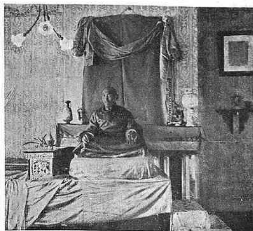
El Buda vivent sobre un tron improvisat en una cambra d'hotel de Darjeeling

a girar els ulls vers l'Àsia Central i dir quelcom del país prohibit, contrada gairebé tan extensa com Espanya, França, Itàlia i Alemanya juntes, que forma una república teocràtica, voltada de misteri i plena de particularitats de vida, una més curiosa que l'altra.