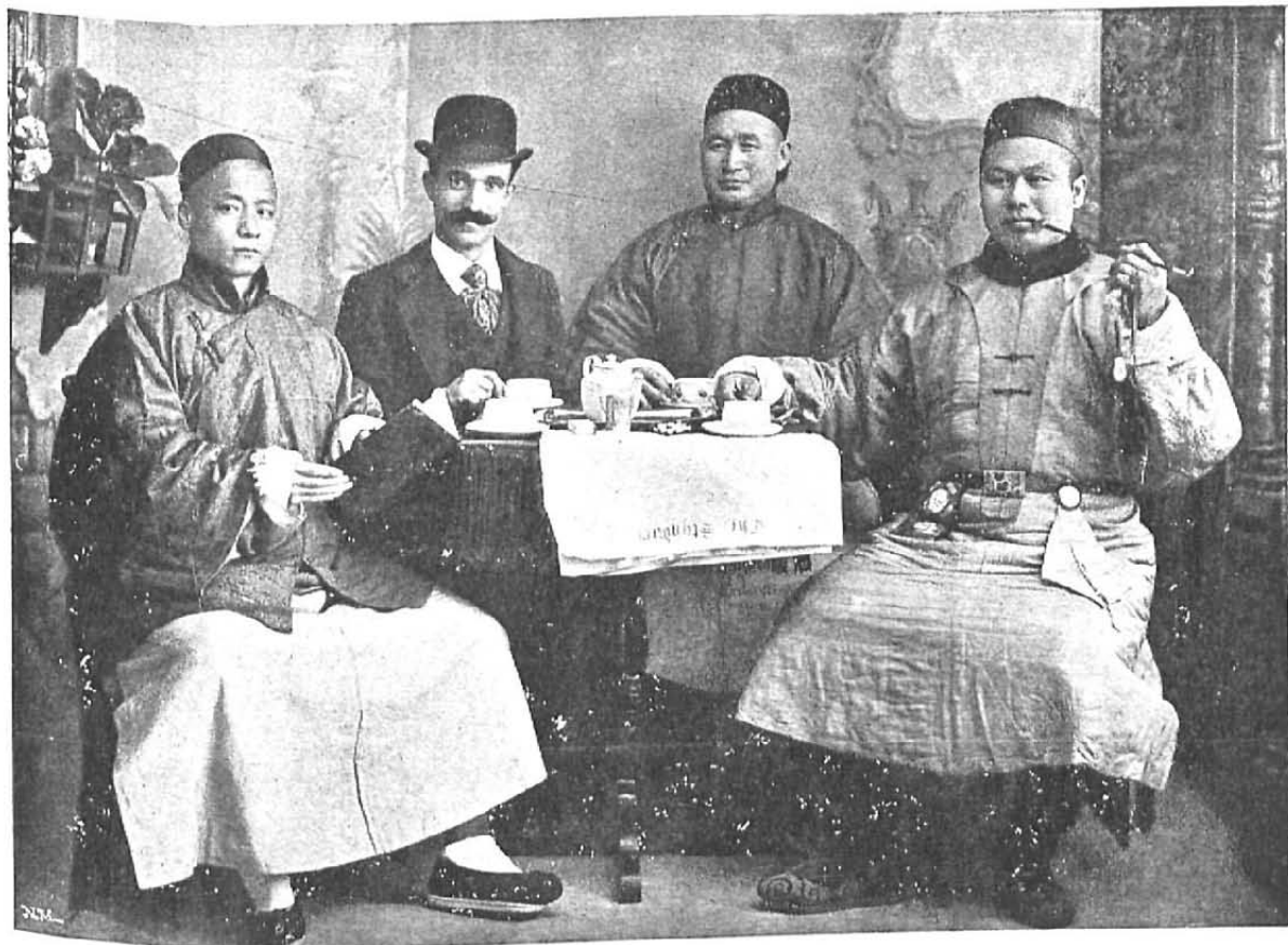
REPRESENTANTES DEL CELESTE IMPERIO EN MADRID