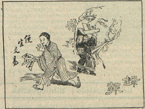
La prensa amordazada no puede protestar contra las maniobras diplomáticas del Japón.

Y finalmente, el último, es una caricatura que no carece de gracia y expresión. El artista chino es más