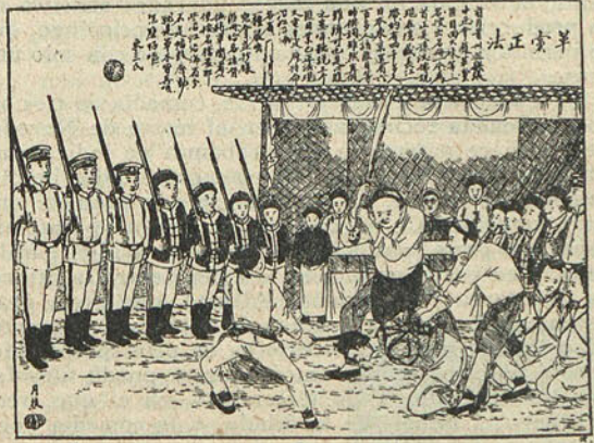
Una ejecución capital.

En el siguiente, inserto en el propio número, representase una escena eminentemente china.