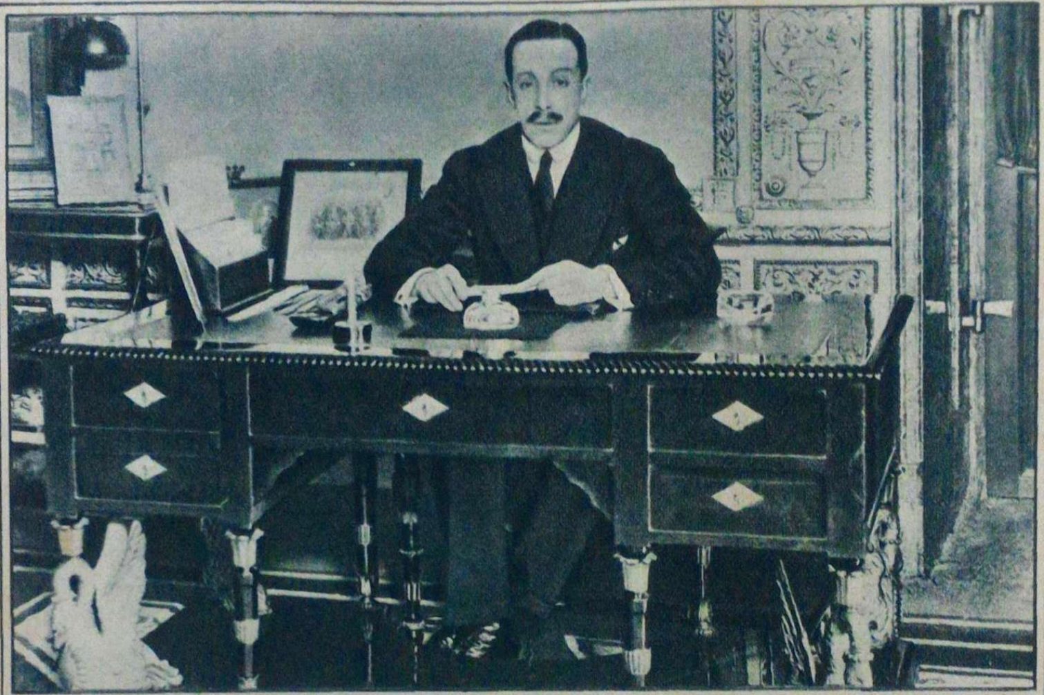
西 王 亞 爾 豐 瑣 十 三