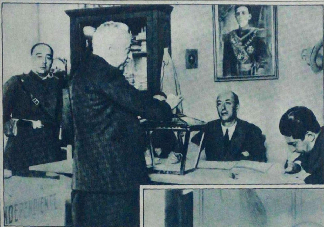
帝政派領袖 曼諾羅內斯投票