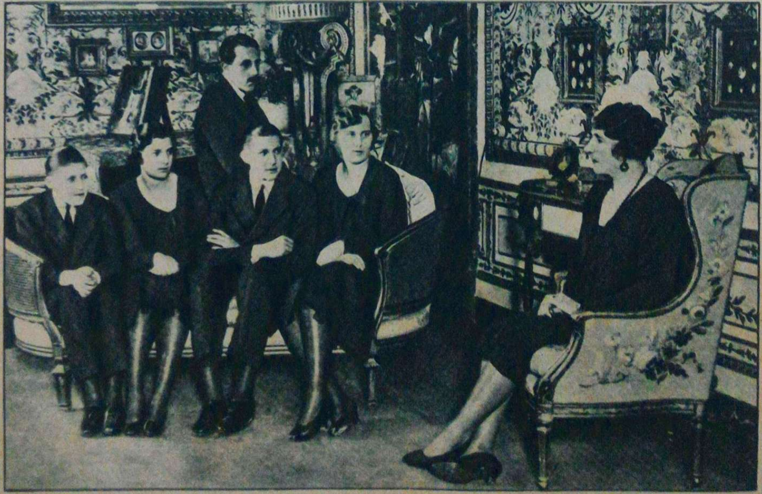
西 后 維 琴 尼 亞 與 其 子 女 五 人